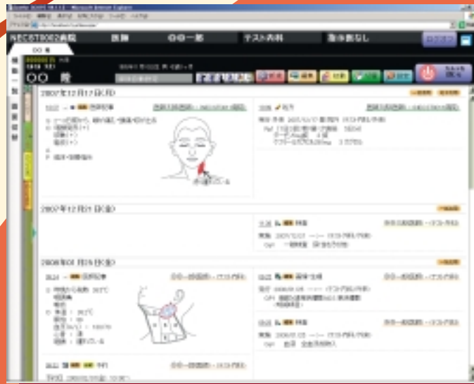
プログレスノート