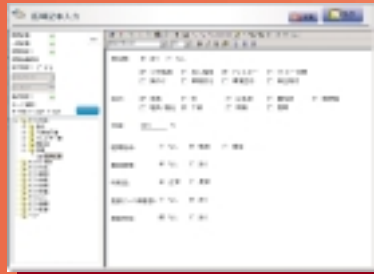
フラットテンプレート